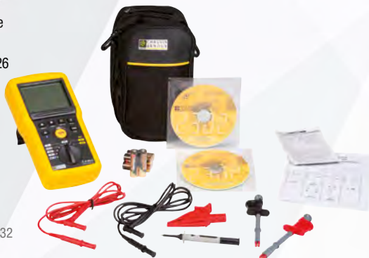
Esempio per il C.A 6532

C.A 6536, idem C.A 6524 + 2 sonde a pinza (rosso e nero).