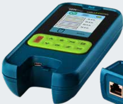
Porta remota removibile RJ45

(coassiale tramite adattatore opzionale)